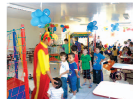
Crianças aproveitam as festinhas de aniversário com os coleguinhas de sala de aula

Aulas extra-classe - 6 a 10 anos Nos dois turnos. Aproveite!