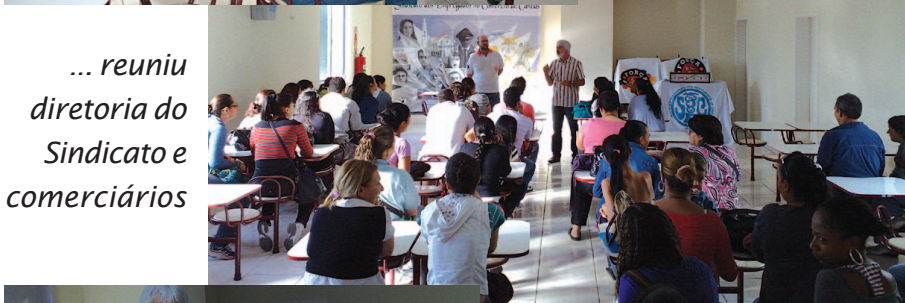
... reuniu diretoria do Sindicato e comerciários