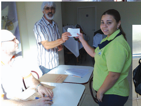
Cada comerciário recebeu um envelope contendo R$ 300,00