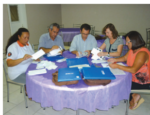
Comissão de apuração