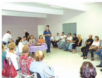
Presidente Fellini agradeceu a grande participação dos comerciantes no pleito