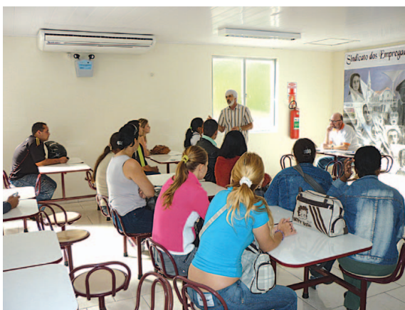
Evento para pagamento da multa...

Cada comerciário recebeu a quantia de R$ 300,00 repassados pelo Carrefour para o Sindicato dos Comerciários. Durante o ato de entrega dos valores, a diretoria do Sindec Canoas explicou aos comerciários do Carrefour sobre função e importância do Sindicato na defesa dos direitos dos trabalhadores.