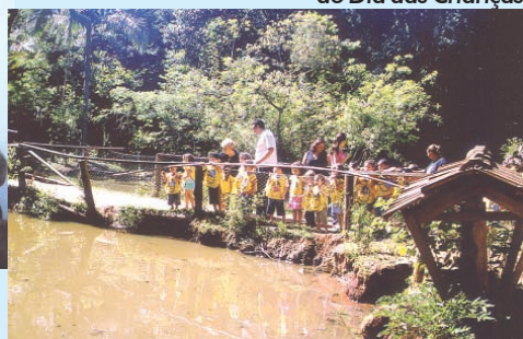
Contato com a natureza, alegria e aprendizado no passeio realizado a Capão do Corvo, como prêmio da gincana, em novembro