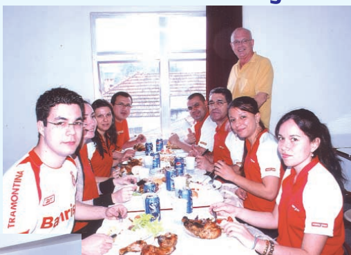
Comerciantes das Lojas Ponto Frio