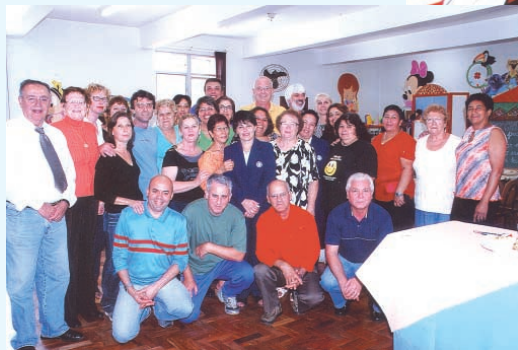
Organizadores do Almoço dos Comerciantes