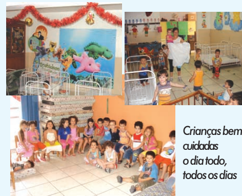
Crianças bem cuidadas o dia todo, todos os dias

Cachoeirinha: Av. Flores da cunha, 1320/103 - Centro Fone: 3470-5804 ou 3470-1438 Gravataí: R. Dorival Cândido de Oliveira, 343/108 Fone: 3488-1844 ou 3488-4989