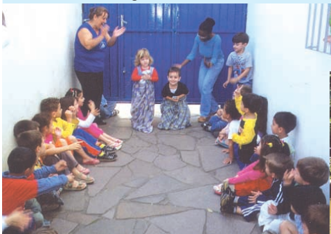
Muita risada e torcida na gincana realizada entre os pequenos, que ganharam um passeio como prêmio