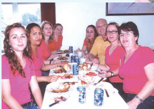
Comerciantes das Lojas Sibrana