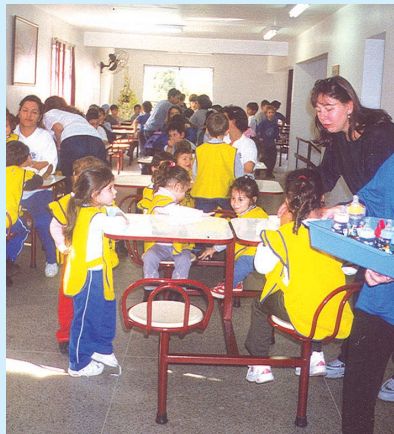
Alegria e confraternização no almoço do Dia das Crianças