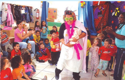
Apresentações teatrais divertem e desenvolvem a criançada e são constantes na Escola