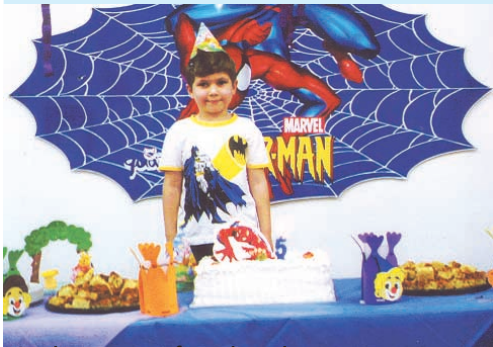
Na última quinta-feira de cada mês, a comemoração dos aniversários da gurizada