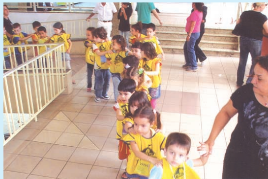
As crianças divertiram-se no Conjunto Comercial Canoas e ainda foram orientadas sobre higiene bucal

Além dos cuidados dispensados todos os dias pela Escolinha, as crianças também divertiram-se a valer nas várias atividades propostas. Confira nas fotos algumas delas!