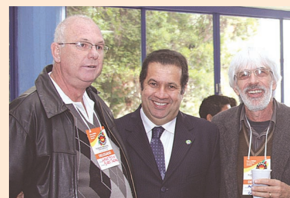
Presidente Fellini junto com Ministro do Trabalho, Carlos Lupi, e Antenor Federizzi, Diretor Financeiro do Sindicato dos Comerciários de Canoas

Na ocasião o Ministro Carlos Lupi fez uma surpresa aos presentes entregando a Carta Sindical da Fetracos - Federação Intermunicipal de Sindicatos de Trabalhadores no Comércio de Bens e de Serviços da Força Sindical no Estado Rio Grande do Sul.