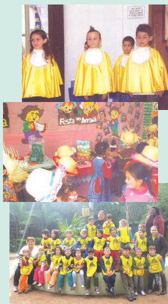
Momentos das crianças na escola: o Arraiá, a formatura do jardim e um passeio