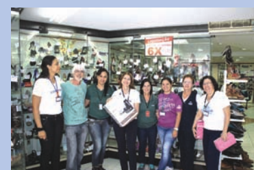
Comerciantes da René Calçados