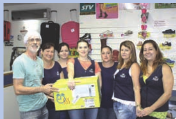
Comerciantes da René Calçados

O sorteio dos prêmios foi realizado durante o almoço que comemorou os 34 anos do Sindec Canoas entre cupons preenchidos por todos os comerciantes.