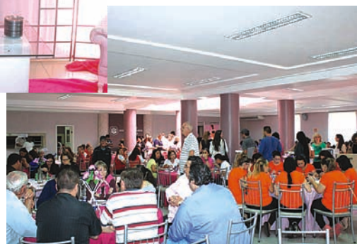
Também houve o sorteio de brindes onde participaram todos os comerciantes presentes ao evento