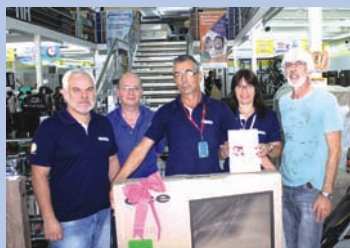
Comerciantes das Lojas Manlec