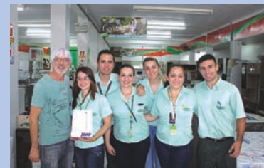
Comerciantes das Lojas Quero Quero