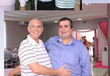
Colegas sindicalistas comerciantes e da Força Sindical também participaram da festa