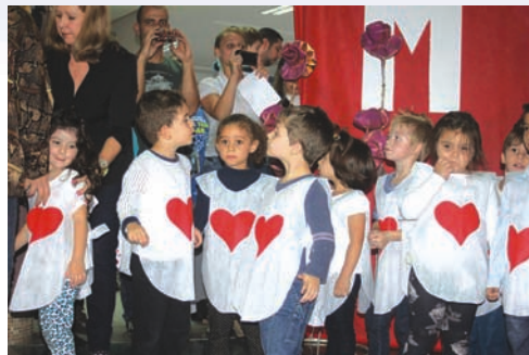
Crianças estavam ansiosas para apresentarem-se para as mães, que adoraram a homenagem

Foram momentos emocionantes, de ternura e carinho que envolveram os dirigentes do Sindec Canoas, educadoras, mães, pais e crianças!