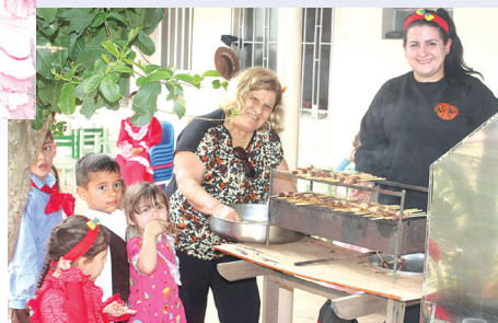
Crianças divertiram-se com as danças e o churrasquinho