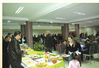
Pais, mães, filhos, funcionários da Escola e diretoria fizeram uma grande confraternização comemorando o Dia dos Pais